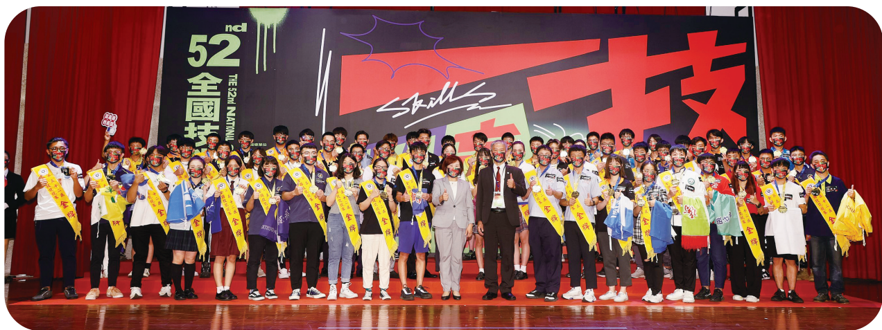
▲ 第52屆全國技能競賽，各職類選手「一技輸贏」，勇奪金牌榮譽。

此外，在勞動部積極的爭取下，國際技能組織亞洲分會（WorldSkills Asia）已經正式宣布台灣取得「2025 亞洲技能競賽」的主辦權，這也是繼1993年於台北舉辦第32屆國際技能競賽後，相隔30年再次取得國際技能賽事主辦權，這也體現出我國長期培育人才技能的豐碩成果，獲得亞洲區域各國的肯定、讓世界再度看見台灣。