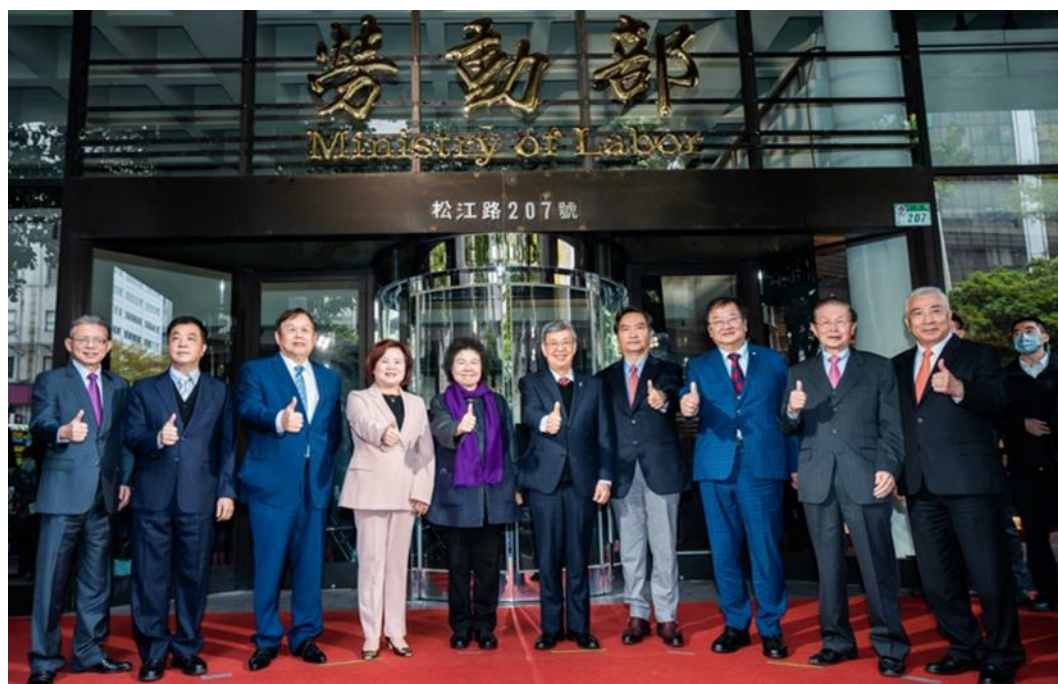
圖5：勞動部進駐松江路志清大樓提供服務。(左起)林三貴前次長、陳雄文前部長、潘世偉前部長、本部部長許銘春、監察院院長陳菊、行政院院長陳建仁、行政院政務委員羅秉成、立法院立法委員邱泰源、趙守博前主委、詹火生前主委