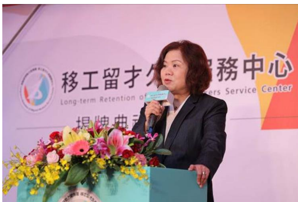
圖18：本部部長許銘春於「移工留才久用服務中心」揭牌典禮致詞