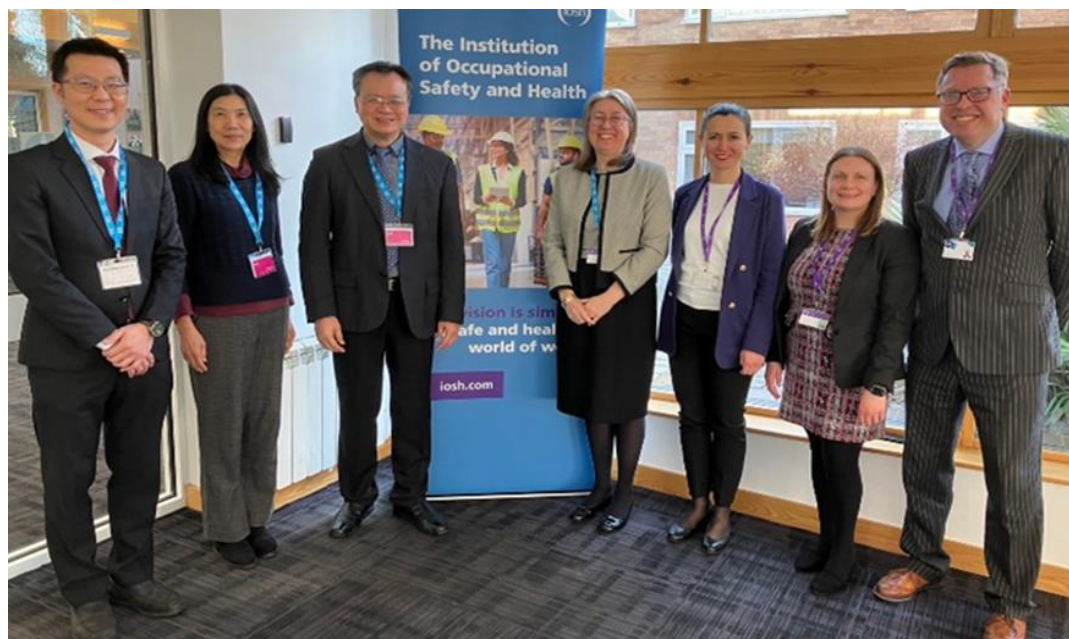
圖3：職業安全衛生署鄒子廉署長拜訪英國職業安全健康學會（IOSH）