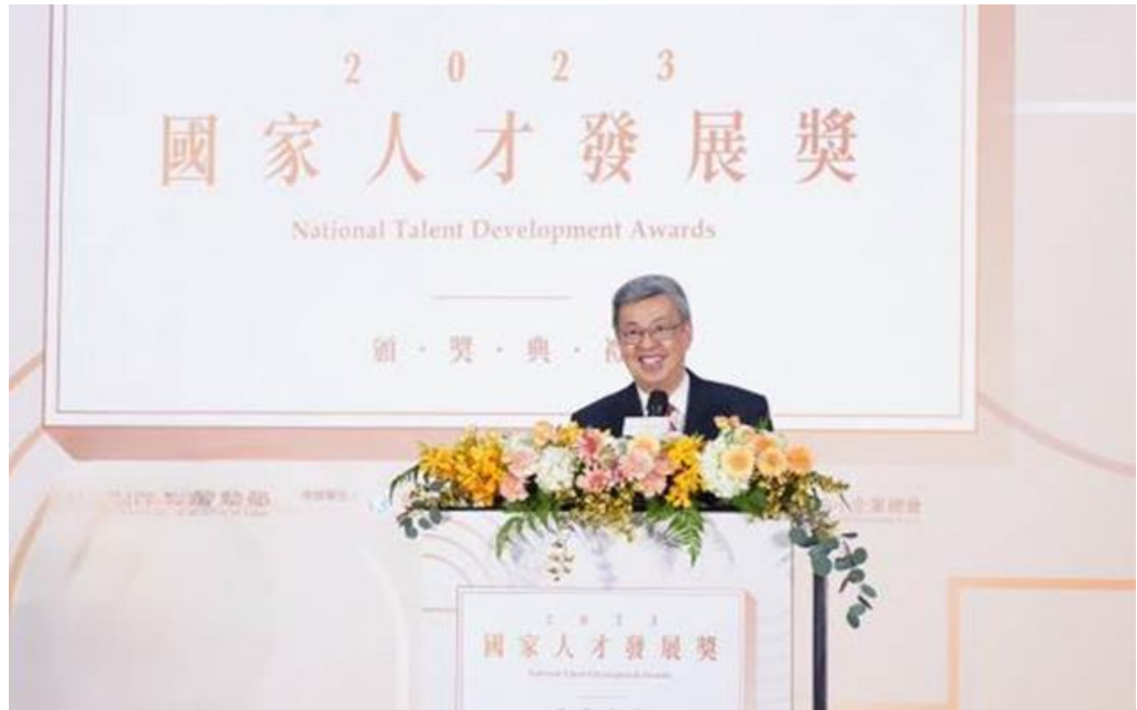
圖15：2023國家人才頒獎典禮行政院院長陳建仁致詞