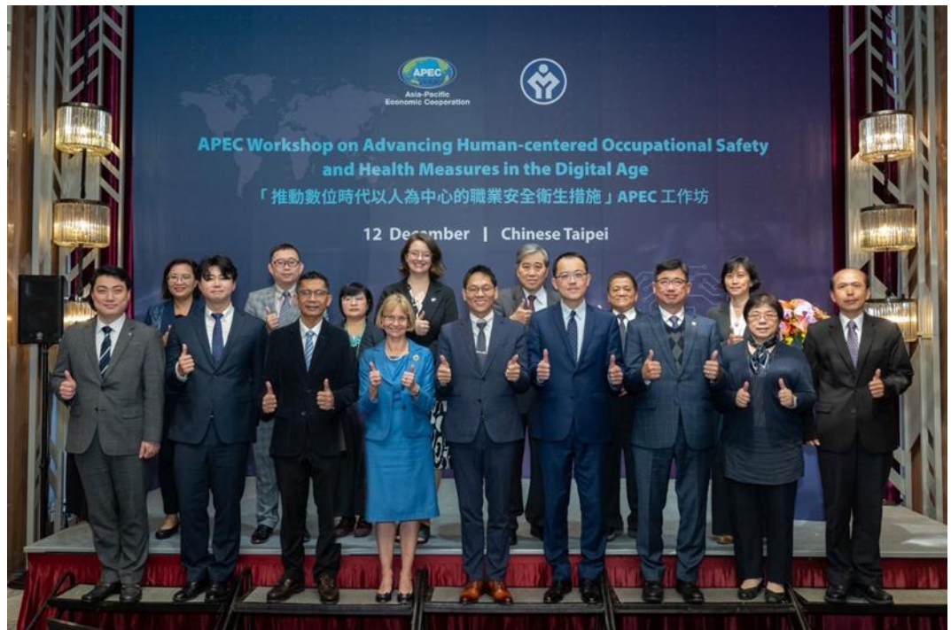
圖21：本部政務次長王安邦（第一排中）於開幕式與貴賓合影

112.12.12 舉辦「推動數位時代以人為中心的職業安全衛生措施」APEC 工作坊，計汶萊、韓國、紐西蘭、馬來西亞、我國、泰國、韓國、美國等8個經濟體以及歐盟改善生活及勞動條件基金會（Eurofound）等國際組織，共72名專家學者與會。