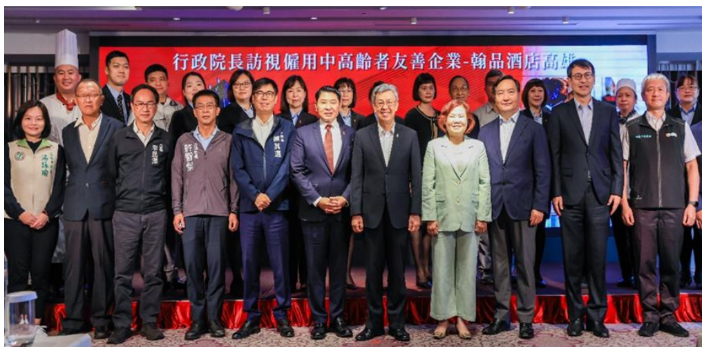
圖7：行政院長陳建仁（前排右4）及勞動部長許銘春（前排右5）蒞臨高雄翰品酒

因應我國人口面臨高齡少子化衝擊，行政院長陳建仁與勞動部部長許銘春視察僱用中高齡友善單位-翰品酒店高雄善用中高齡者及高齡者人力情形，期勉事業單位與政府共同合作營造友善就業環境。