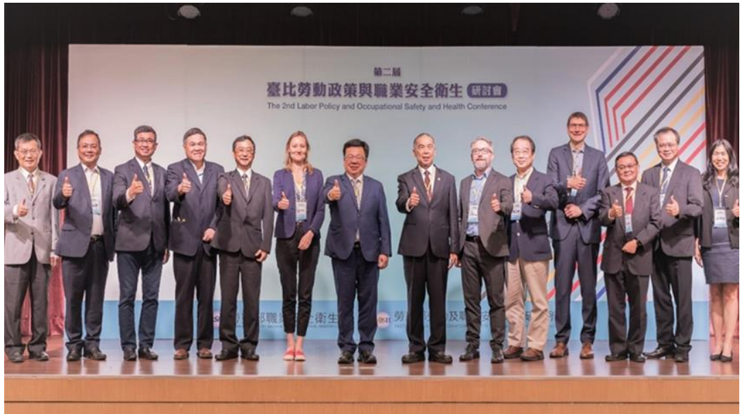
圖7：本部政務次長李俊俛及HIVA研究人員等人揭幕合影