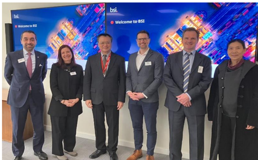
圖4：職業安全衛生署鄒子廉署長拜訪英國標準協會（BSI）