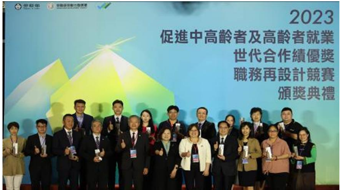
圖4：本部部長許銘春（右6）、立法院吳玉琴委員（右5）及本部勞動力發展署署長蔡孟良（左5）與績優單位及績優人員大合照。