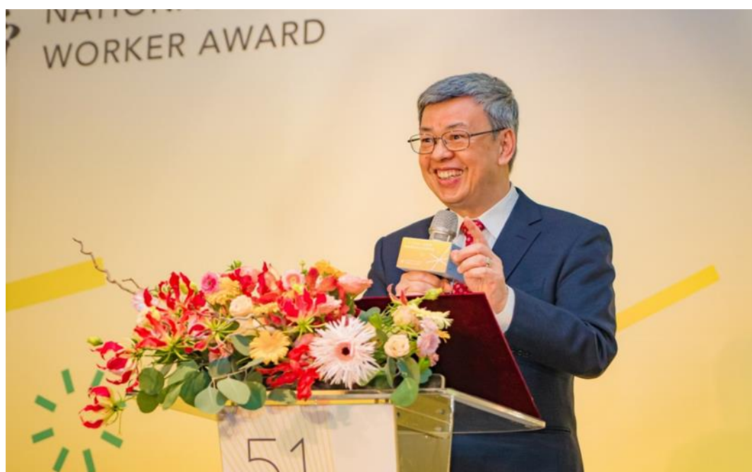
圖3：行政院陳建仁院長出席「112年五一勞動節全國模範勞工表揚典禮」並致詞