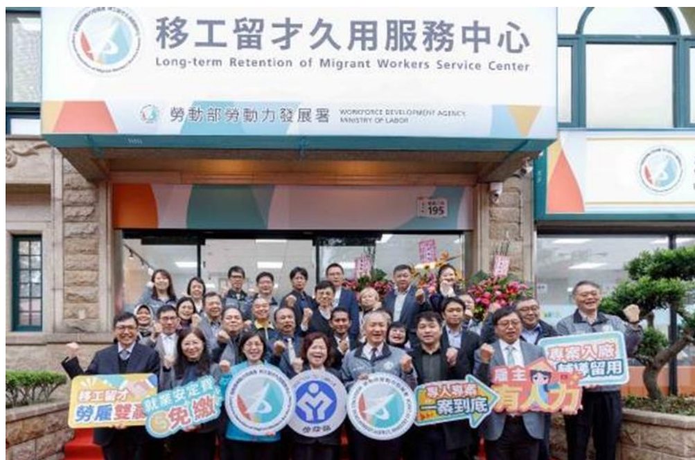
圖17：本部部長許銘春（右5）、本部勞動力發展署署長蔡孟良（右4）、本部勞動力發展署副署長賴家仁（右1）及與會貴賓合影