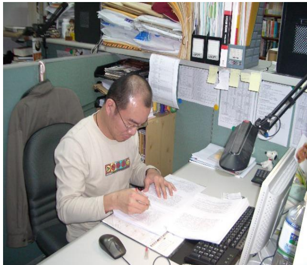
編輯正在辦公桌前從事審稿的工作