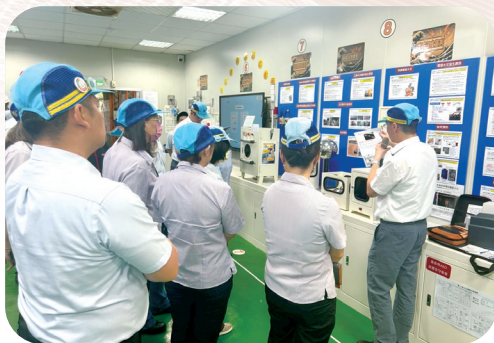
▲「安全教育道場」是建上工業推動安全文化與教育訓練的重要基地，將安全理念深植於企業文化中。

公司在福祉制度上也展現人本關懷：提供每日免費午餐、防暑物資與下午茶點，補充員工體力；全體員工享有每年一次健康檢查；每年定期檢查員工機車胎紋並提供母公司建大輪胎購買優惠；每年8月一週有薪長假；並針對員工參與客戶公