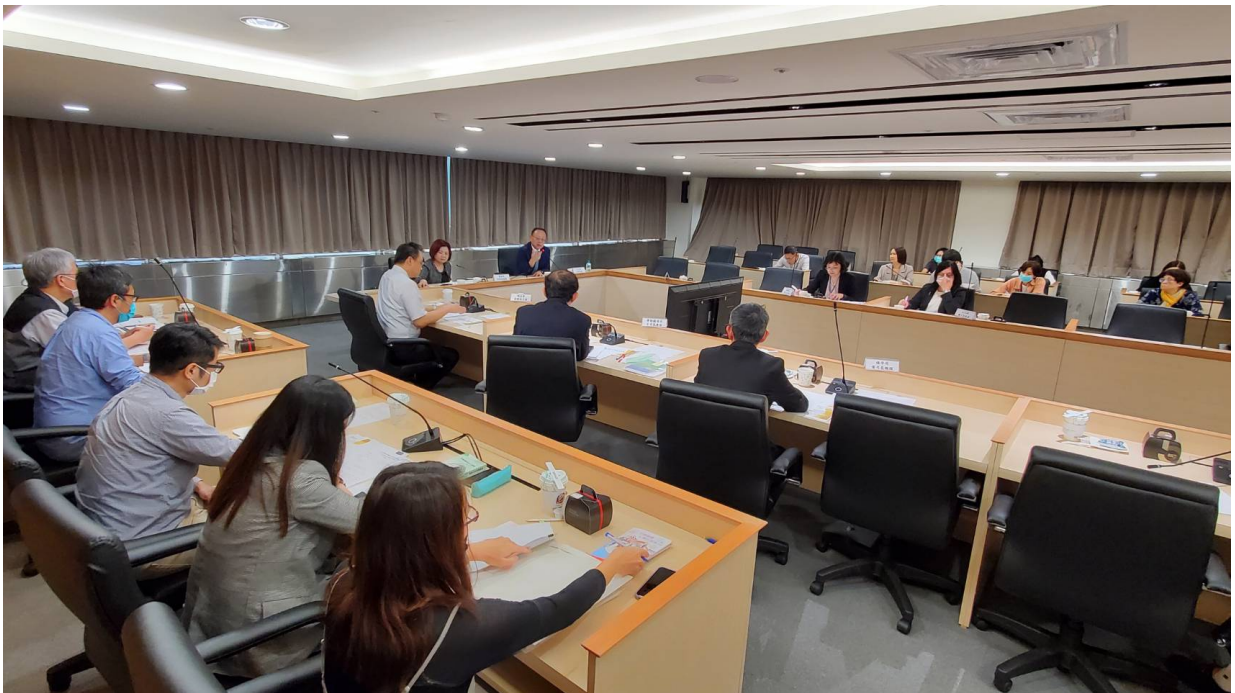
勞動部與文化部雙首長會議進行交流及討論，助益影視產業正向發展

勞動部表示，透過此雙首長會議，二機關將建立常態雙向溝通機制，文化部能定期掌握影視產業之勞動檢查結果及處理情形，一同監督及協助劇組工作者職場環境及勞動權益改善情形，未來合作亦將會更加緊密，協助影視產業健全安全衛生管理制度，促使劇組製片單位落實勞動法令規定，以營造健全之影視產業勞動環境。