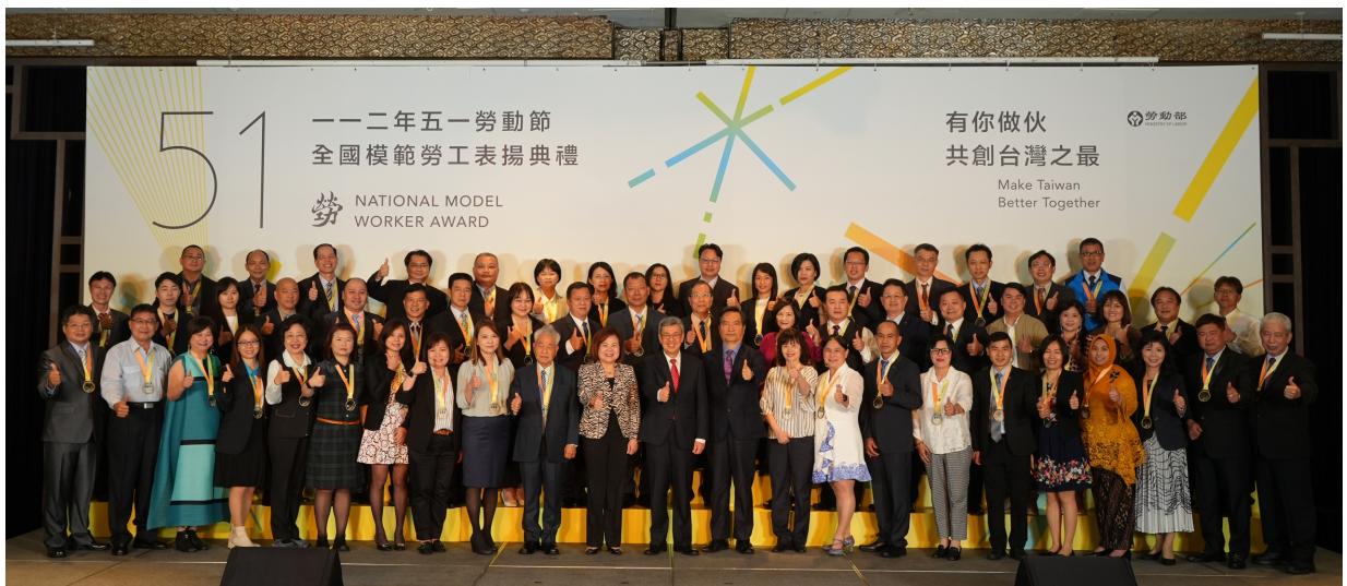
行政院陳建仁院長與勞動部許銘春部長和在场56位全國模範勞工合影

勞動部表示，112年獲獎的56位勞工包括來自於傳統製造業、高科技產業、交通運輸、醫療事業、民生服務業、媒體影視業從業勞工以及手工技藝、餐飲業及陶瓷彩繪等專精勞工，還有為勞工發聲的工會領袖與會務人員，以及產業類與社福類移工等多元領域，展現出勞工朋友於不同行職業崗位中的專業貢獻及卓越表現。百業百工疊織為社會的面貌，未來勞動部會繼續努力，推動符合勞工所需的法令與政策，堅定地做全國勞工朋友的有效後盾。