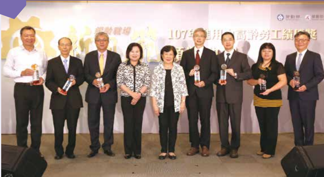
勞動部部長許銘春（左 4）及勞動部勞動力發展署署長黃秋桂（右 5）與第一組獲獎單位合影。

依內政部統計，65 歲以上老年人口占總人口比率在 107 年 3 月底達到 14.05%，臺灣已經正式進入高齡社會，而且我國 15 歲至 64 歲工作年齡人口已於 104 年達最高峰後逐步下降，因此，如何活化並留用中高齡及高齡勞動力，是我國不容忽視的重要議題。