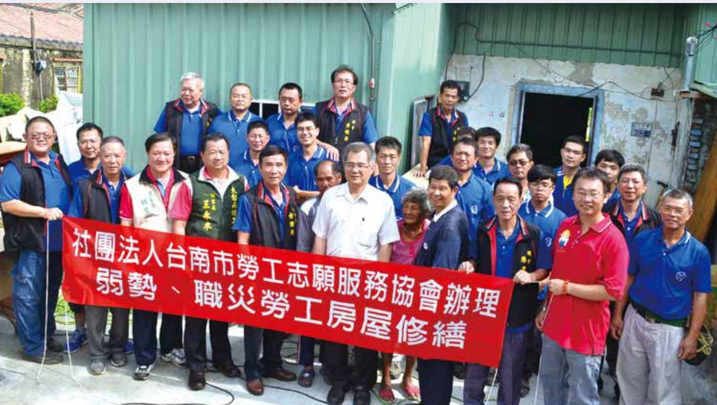
台南志協辦理弱勢、職災勞工房屋修繕。

臺南市政府勞工局結合大台南總工會、社團法人台南市勞工志願服務協會、台南市木工業職業工會等單位共同協助弱勢職災勞工進行房屋修繕，透過各工會志工出錢出力並發揮所長，協助其改善居住環境品質，恢復家庭功能，獲得多方讚賞；103 年將此計