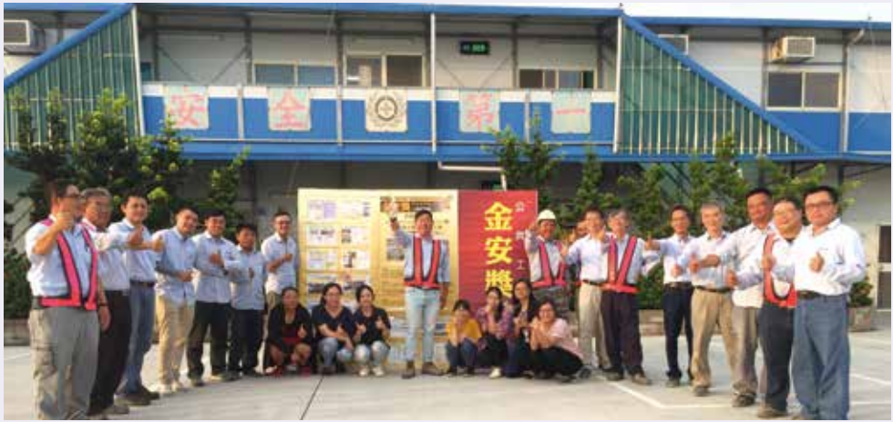
新亞建設開發股份有限公司工程團隊。