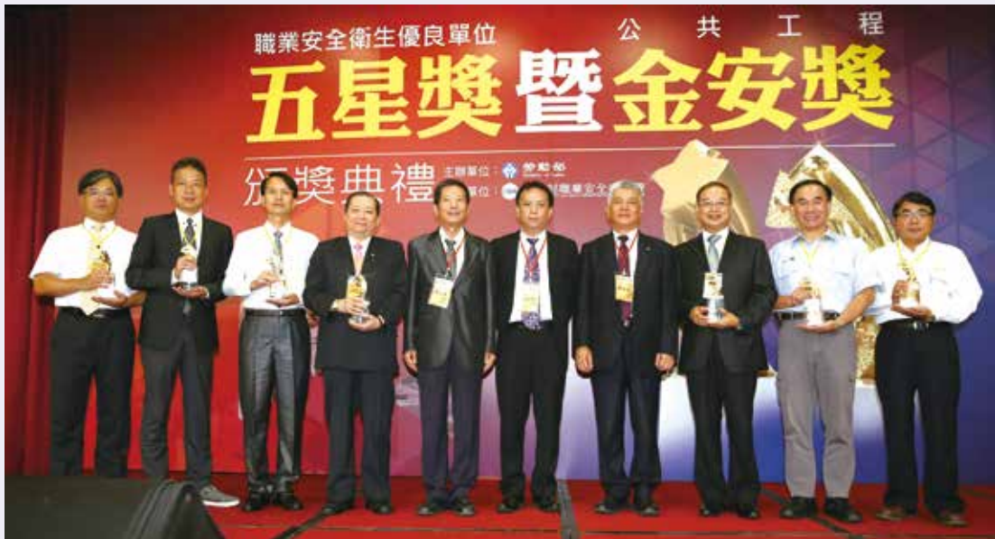
勞動部政務次長施克和與金安獎得獎工程之單位代表合照。