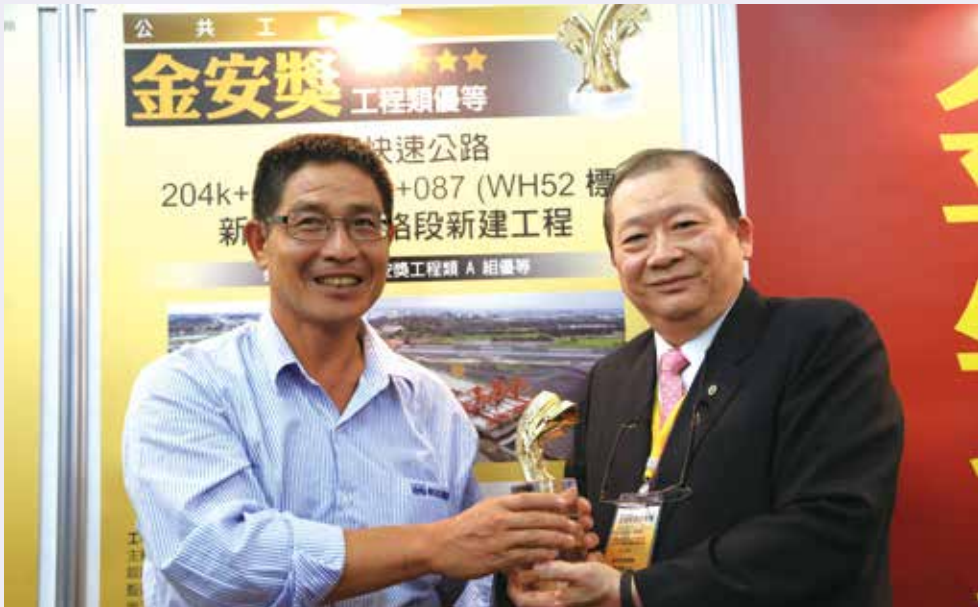
新亞建設開發股份有限公司工程團隊。

道衝擊。於設計階段依量化風險評估結果，採用較安全施工方法，並將風險資訊傳遞至細部設計，新亞建設施工前運用建築資訊模型(BIM)模擬施工，有效控管作業可能之風