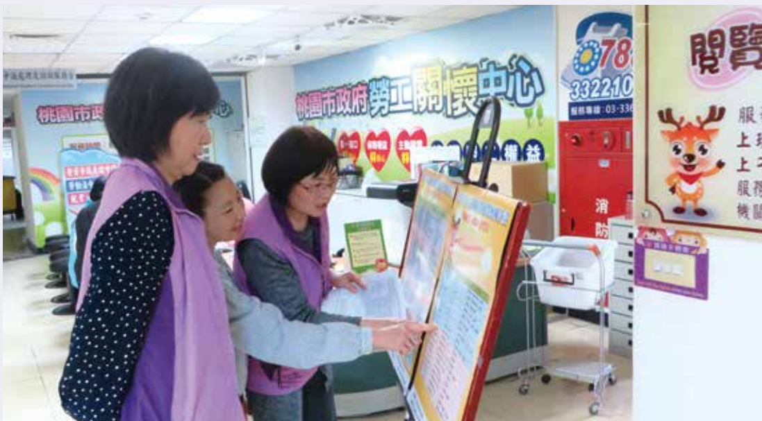
勞工志工熱情為民眾提供諮詢。

畫擴大至弱勢家庭，透過社會局及勞工局一同合作，期望能讓更多人受惠，另結合台南市泥水職業工會、台南市油漆工程業職業工會、台南市電氣業職業工會、台南市鋁製品製造裝配職業工會、台南市金屬建築結構及零組件製造職業工會、台南市餐飲業產業工會等志工也一併加入修繕行列，迄今(107)年已完成 81 戶弱勢家庭房屋修繕。