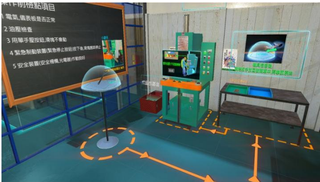
圖 2 衝剪機械作業情境