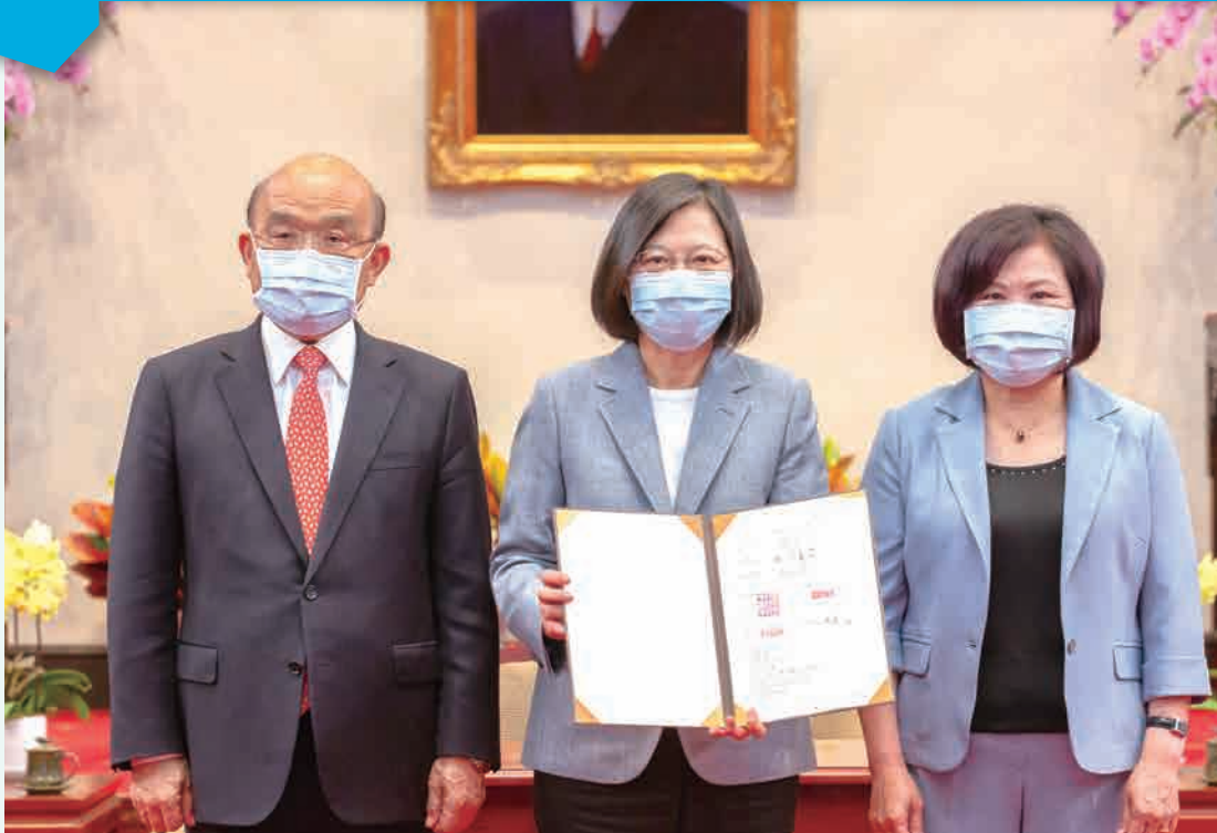
總統蔡英文於 110 年 4 月 30 日公布「勞工職業災害保險及保護法」