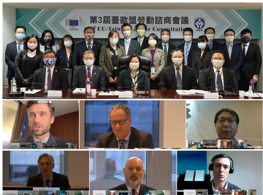
勞動部許銘春部長率同仁出席臺歐盟諮商會議

會議中雙方就「職業安全衛生策略、進展及研究」及「因應COVID-19之職業安全衛生及其他措施」議題交流，並就平臺與零工經濟及綠色經濟等職業安全衛生議題進行熱烈討論，雙方均認同新技術與新工作型態同時為勞動市場帶來機會與挑戰，並期盼未來就個別議題進行更深入的交流，開啟臺歐盟職業安全衛生交流合作新頁。