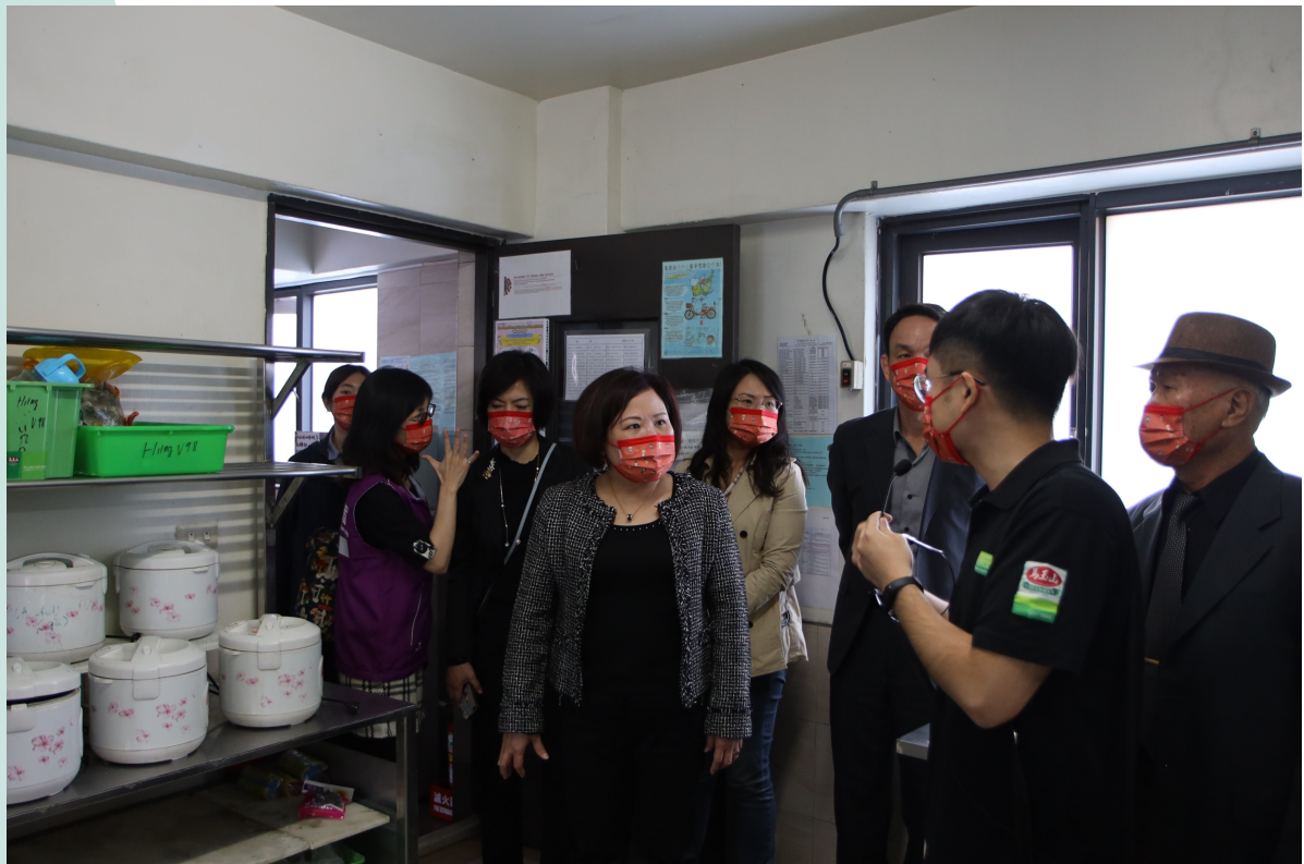
勞動部許銘春部長訪視馬玉山公司廠區及移工宿舍防疫情形

許部長提醒，養成防疫好習慣，出入人多場所請務必配戴口罩，保持手部清潔及保持社交距離，共同積極防疫。勞動部關心每位移工朋友，提供免付費、24小時全年無休、雙語及免付費申訴諮詢服務的1955專線，為民眾解答防疫問題、勞動權益相關問題或通譯需求等，多國語防疫宣導訊息可上跨國勞動力權益維護資訊網站防疫專區查詢。