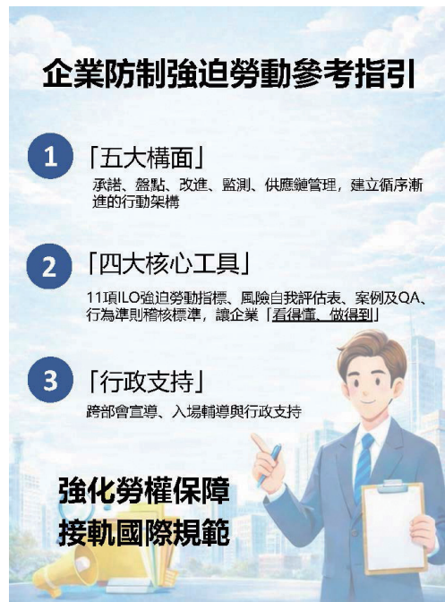
▲ 圖 2 勞動部「企業防制強迫勞動參考指引」的三大亮點

（如圖 2），未來將持續透過跨部會宣導及入場輔導等行政支援措施，協助企業在保護勞工權益的同時，同步提升企業形象與在全球永續供應鏈中的長期競爭地位。