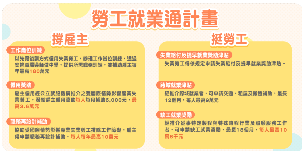
▲ 圖3：勞工就業通計畫說明