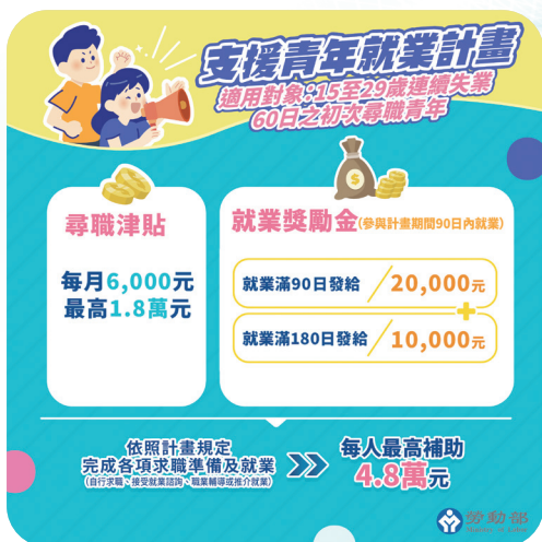
▲ 圖2：支援青年就業計畫補助說明