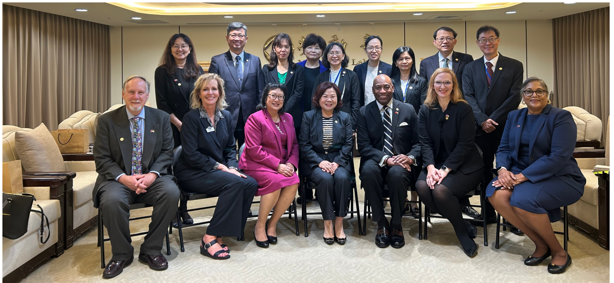
許銘春部長與美國聯邦暨各州勞工行政官員訪團合影

外賓訪臺期間，並規劃拜會監察院國家人權委員會、臺南市政府、勞動部職業安全衛生署、勞動力發展署及勞動及職業安全衛生研究所等單位，以瞭解我國人權保障、職業安全衛生及勞動力發展等議題之發展概況；另安排訪賓參觀我國多元就業輔導單位，瞭解勞動部如何協助身心障礙者及就業弱勢者在地就業，期望藉此深入瞭解臺灣的勞動政策與執行成效，並攜手深化臺美勞動事務的合作夥伴關係。