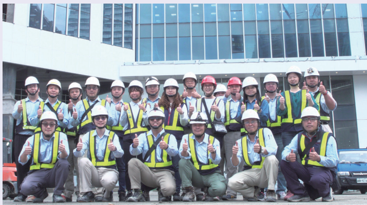
台灣肥料股份有限公司提供安全與健康的工作場所，讓每位員工都能安心工作

定自行負擔普篩成本，並安排特約醫療院所直接至工地進行人員普篩，過程中也檢測出一些疑似案例，再轉介至專責醫院進行 PCR 檢測及相關通報，另外，更採購衛生福利部核准之居家型快篩劑，實施快篩。在這個缺工、缺料的大環境，此措施發揮穩定軍心的功效，讓所有員工都能安心上班。