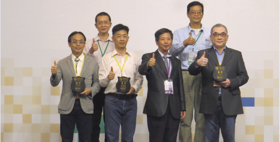
台肥南港 C2 旅館暨辦公大樓新建工程榮獲民間工程類佳作獎