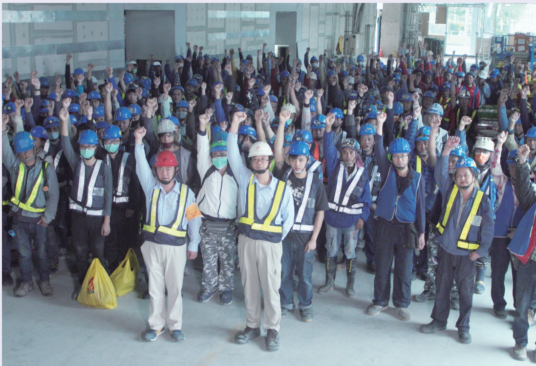
工程開工迄今零災害，未來工程團隊仍會持續朝著零職災的目標前進

除了運用各樣科技於施工前做好相關安全規劃，更重視勞工職場權益保障、身心關心照護及作業環境安全衛生福祉設置採購，加強勞工職安衛教育訓練推行，並持續要求同仁於施工中落實各項職業安全衛生的要求，將安全的理念落實到每一位勞工身上，強化團隊執行能力，並推行至其他工地參考，定能對工地及勞工有所受益及改變工地文化，提升整體安全文化。