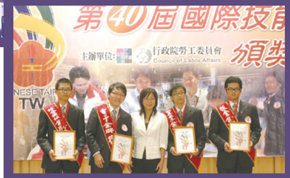
勞委會主委王如玄親臨主持頒獎典禮，嘉勉選手。

第 40 屆國際技能競賽經過激烈的競爭，台灣選手傳來好消息，一口氣拿下 4 金 8 銅及 17 項優勝，以獲得前 3 名獎牌數計，我國名列參賽國第 4 名，成績輝煌。