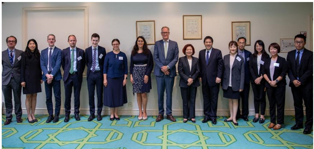
圖13：許銘春部長與歐盟就業總署長（左8）於臺歐盟勞動諮商會議合影