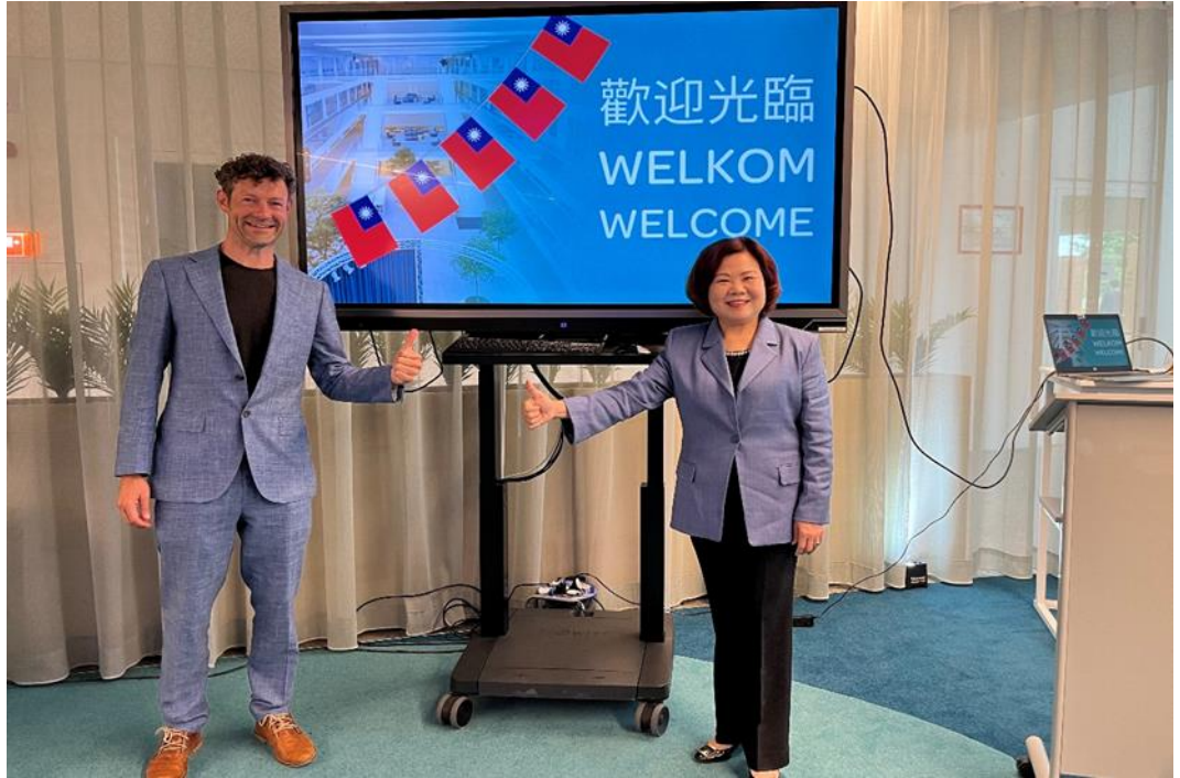
圖14：許銘春部長與 VDAB 總署長合影