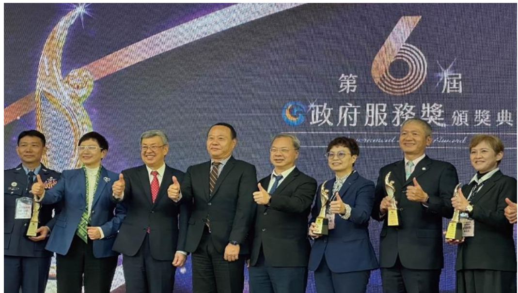
圖20：行政院院長陳建仁（左3）頒發政府服務獎，由本部勞動力發展署署長蔡孟良受獎（右2）