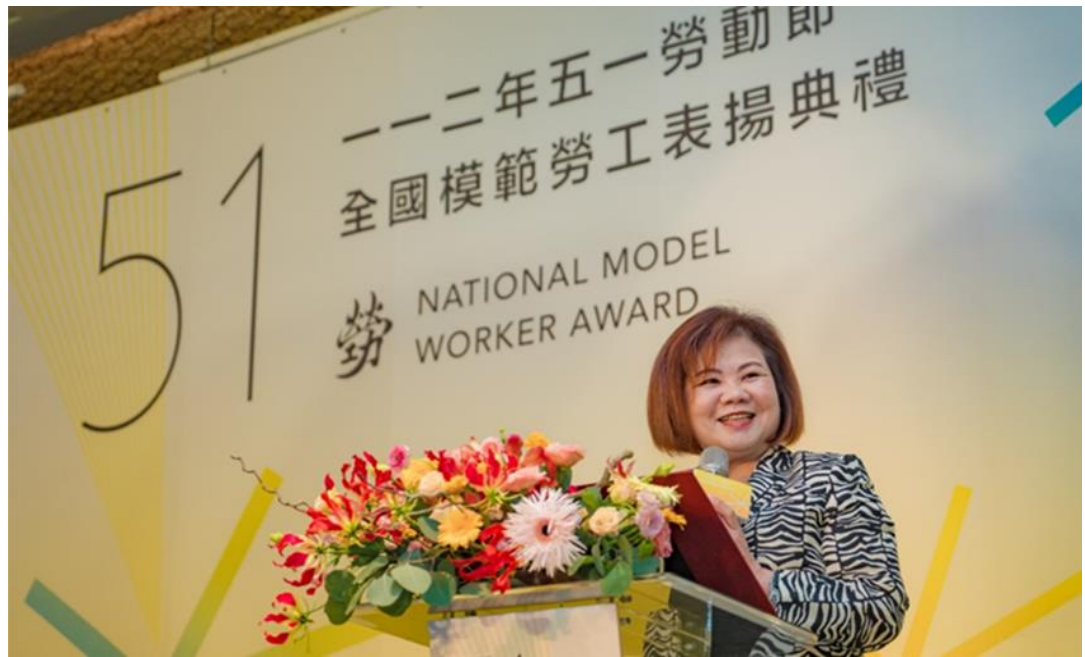
圖4：許銘春部長在「112年五一勞動節全國模範勞工表揚典禮」致詞