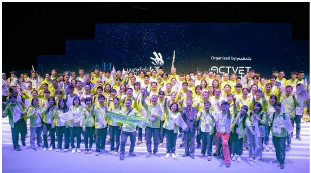
圖9：2023亞洲技能競賽代表團大合影

2023亞洲技能競賽(WorldSkills Asia Abu Dhabi 2023)於阿拉伯聯合大公國阿布達比辦理，我國遴派青年組20個職類21位國手、青少年組7個職類8位國手及表演賽2個職類2位國手參賽，獲得12金6銀4銅3優勝、亞洲排名第一之佳績。