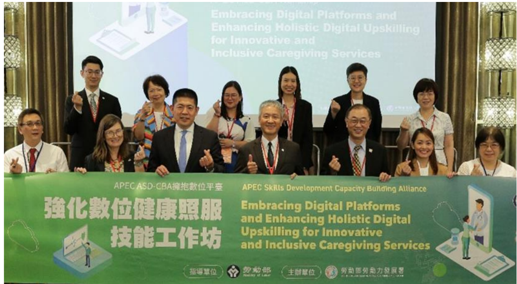
圖12：勞動力發展署蔡孟良署長與 APEC 人力資源發展工作小組總主席 Zhao Li 及其他外賓合影