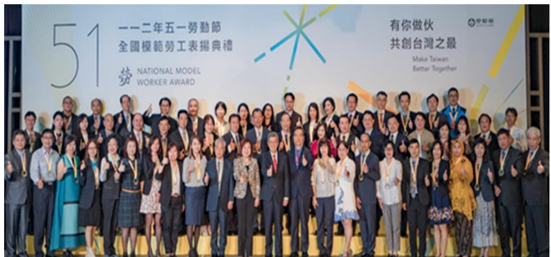
圖5：行政院陳建仁院長（圖中）與許銘春部長（中左）與在場56位全國模範勞工合影留念