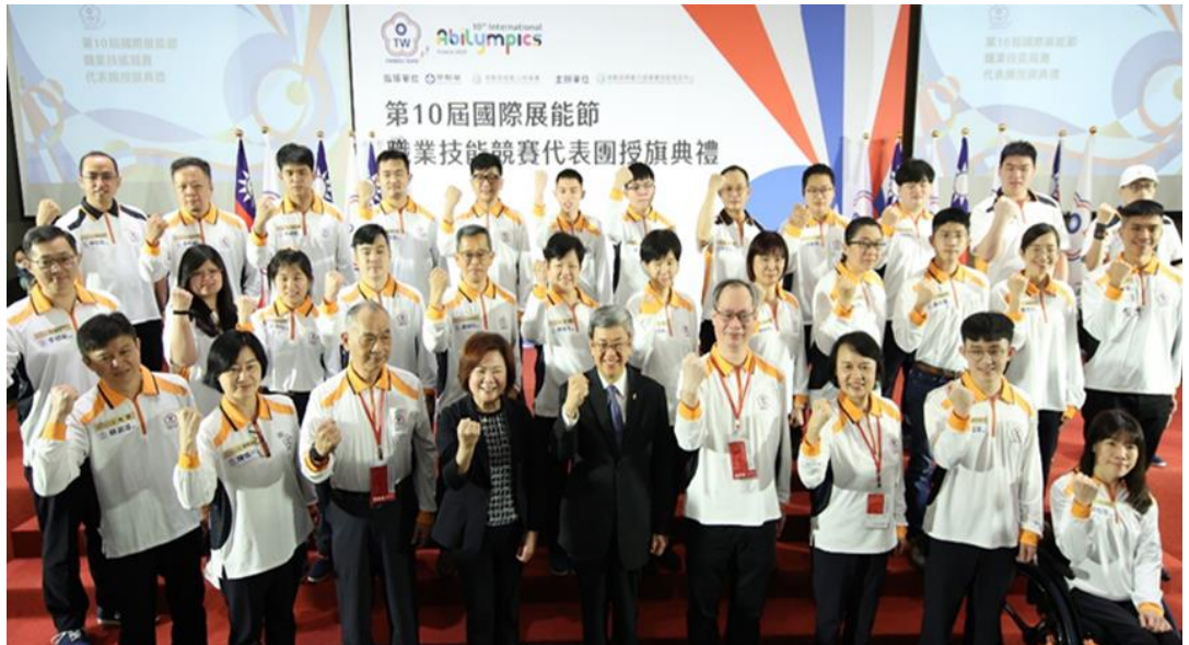
圖7：行政院院長陳建仁、本部部长許銘春及第10屆國際展能節職業技能競賽國手合影