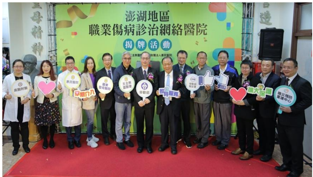
圖2：本部常務次長陳明仁、澎湖縣長陳光復與惠民醫院院長張明哲及揭牌來賓合影

112.01.10 輔導澎湖地區惠民醫院成為離島地區首家職業傷病診治網絡醫院，宣示共同守護離島地區勞工朋友身心健康。