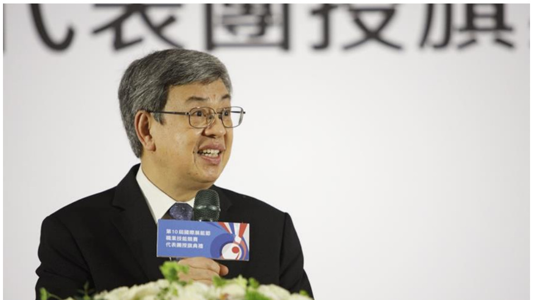
圖8：行政院院長陳建仁親臨第10屆國際展能節職業技能競賽授旗典禮嘉勉國手