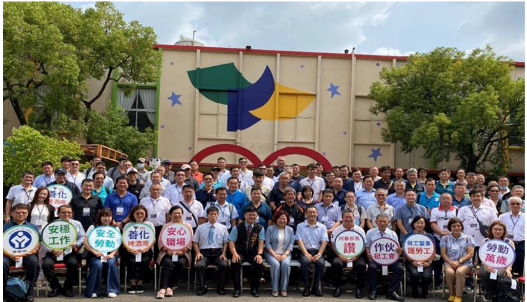
圖11：許銘春部長與勞工董事及所屬工會理事長參訪台南善化啤酒廠

酒股份有限公司台南善化啤酒廠進行參訪，藉由公司及工會經驗分享，瞭解企業公司治理面向的相關實務，提升勞工董事在董事會中的角色功能。許銘春部長亦出席參與本項研習，向勞工董事及其所屬工會理事長說明當前勞動政策，並對維護勞工權益不遺餘力的勞工董事們表示感謝。