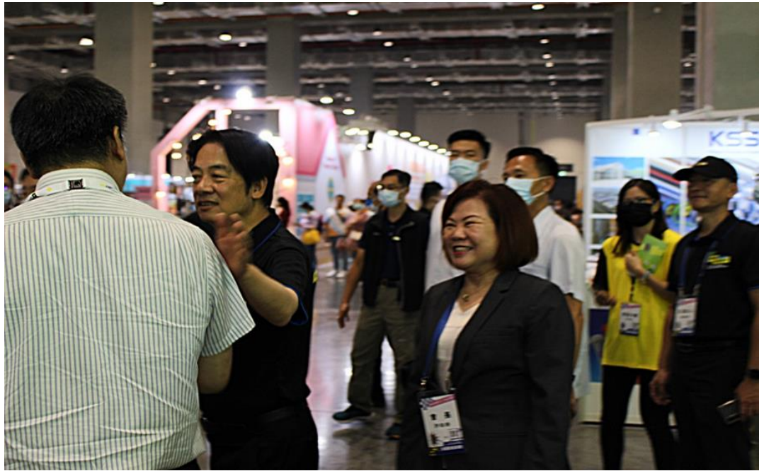
圖4：許銘春部長陪同副總統賴清德造訪職業安全衛生設施觀摩體驗活動