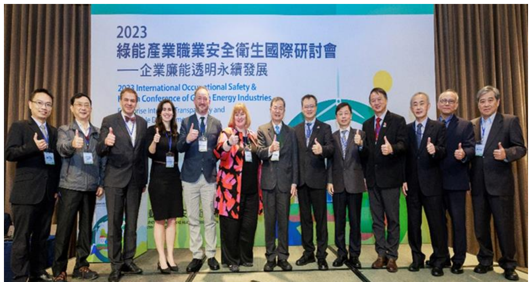
圖12：112年「綠能產業職業安全衛生國際研討會」國內外專家相互分享綠能產業安全衛生發展趨勢及實務作法

辦理112年「綠能產業職業安全衛生國際研討會」，邀請英國安全衛生執行署、德國聯邦職業安全與健康研究所、國際勞工檢查協會、日本高壓氣體保安協會、台船環海風電公司、風睿能源公司、沃旭能源公司等綠能專家學者交流分享，同時邀請英國在台辦事處、德國在台協會及我國綠能產業高階主管與會，聚焦離岸風電、太陽光電及氫能安全，精進我國綠能產業之職業安全衛生水準。