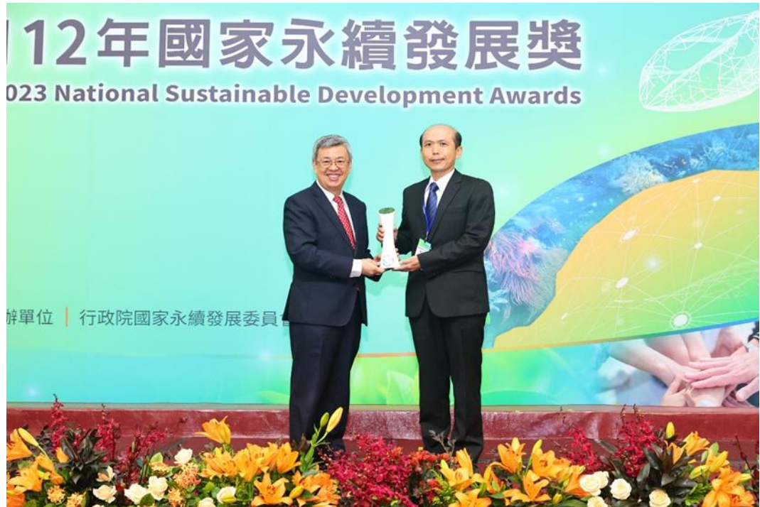
圖11：行政院院長陳建仁親自頒獎，本部職業安全衛生署副署長林毓堂代表受獎。