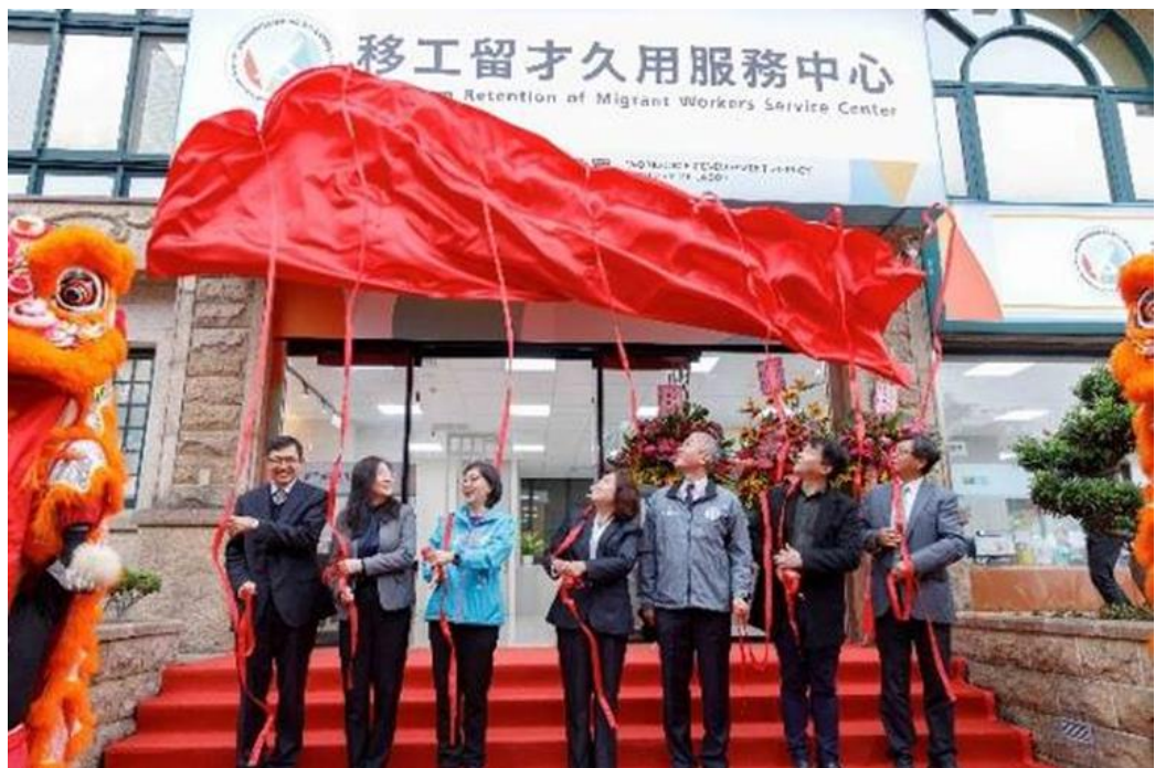
圖16：本部部長許銘春（右4）、本部勞動力發展署署長蔡孟良（右3）及與會貴賓共同揭牌成立「移工留才久用服務中心」

成立「移工留才久用服務中心」，提供雇主申辦中階技術人力申辦前之應備文件取得、聘僱中之案件釐清及聘僱後之輔導留用等服務，解決雇主申辦中階技術人力之聘僱疑義，提供優質便民服務。