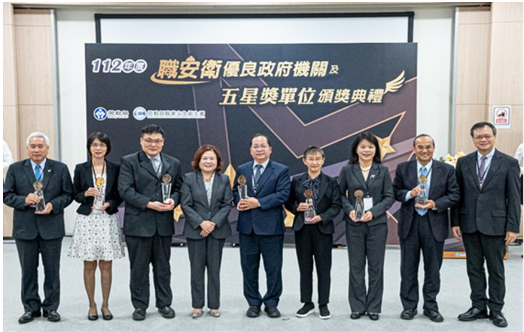
圖6：本部部長許銘春與職安衛績效優良中央政府機關合影。