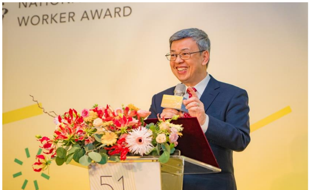
圖3：行政院陳建仁院長出席「112年五一勞動節全國模範勞工表揚典禮」並致詞