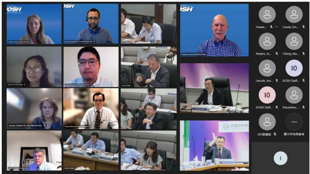
圖1：辦理「2023本所與美國國家職業安全衛生研究所國際研究合作交流會議」