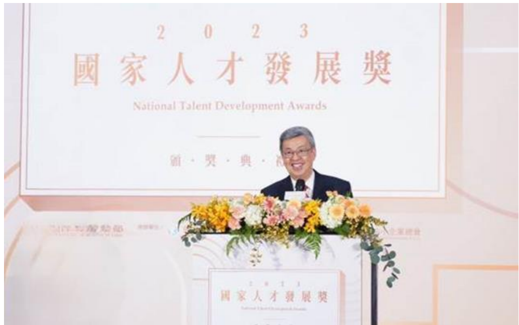
圖15：2023國家人才頒獎典禮行政院院長陳建仁致詞