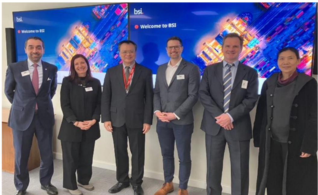
圖4：職業安全衛生署鄒子廉署長拜訪英國標準協會（BSI）

112.02.09 公告令釋身心障礙者權益保障法第96條第2款所稱私立機關（構）「無正當理由」違反定額進用規定之情形，以積極協助地方政府落實輔導未足額進用單位及對無正當理由違反定額進用義務之單位依法裁罰，以敦促義務單位足額進用。