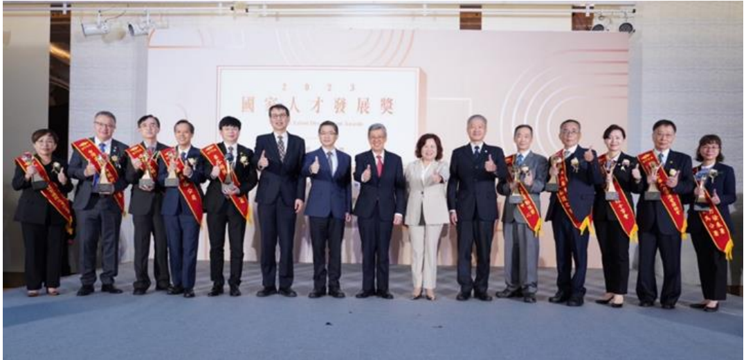
圖13：2023國家人才頒獎典禮合影1

辦理「2023國家人才發展獎(2023 National Talent Development Awards)」頒獎典禮，該獎項為我國人力資源領域唯一國家級獎項，表彰人力發展、創新及效益績優之得獎單位，並樹立學習楷模，計表揚大型企業、中小企業、機關(構)團體及非營利團體等10家得獎單位與傑出個案獎等7家得獎單位。