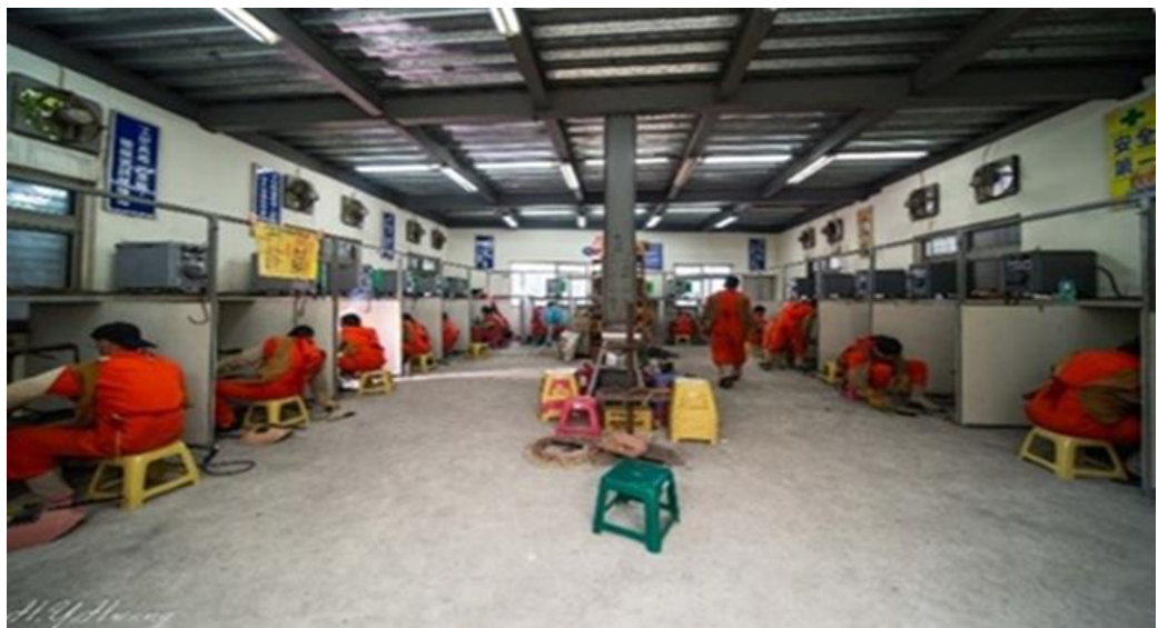
圖9：學員於乾式電銲教室進行陸域銲接訓練

勞動及職業安全衛生研究所結合國內相關產業及協會，成立水下銲接教材編審委員會，完成12種銲工潛水員課程共24小時之教材編撰，試辦國內首次職業水下銲接專業人員培訓班，學員並全數取得國際銲接潛水員B級銲接的資格，與國際接軌。