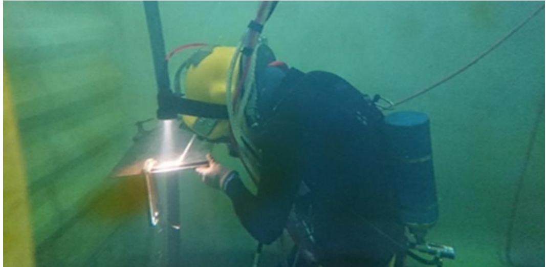
圖10：學員身著水面供氣設備進行水中銲接訓練