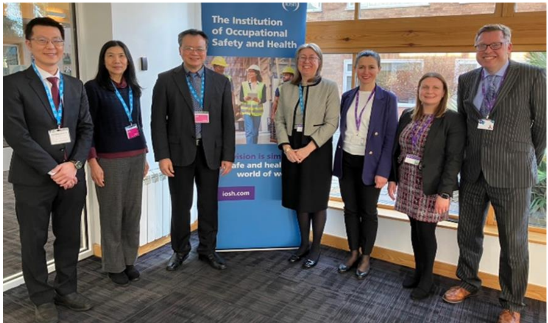
圖3：職業安全衛生署鄒子廉署長拜訪英國職業安全健康學會（IOSH）