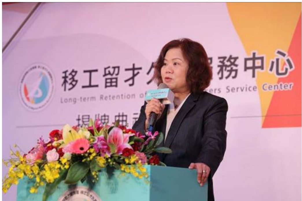
圖18：本部部長許銘春於「移工留才久用服務中心」揭牌典禮致詞