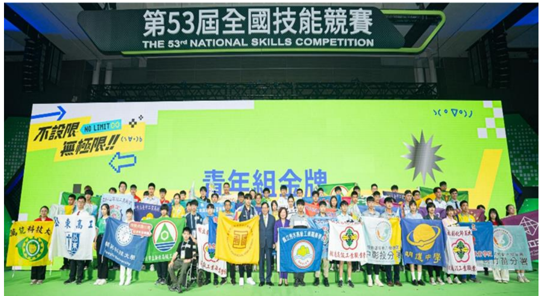
圖2：行政院長陳建仁、部長許銘春及出席長官為第53屆全國技能競賽開幕典禮揭幕