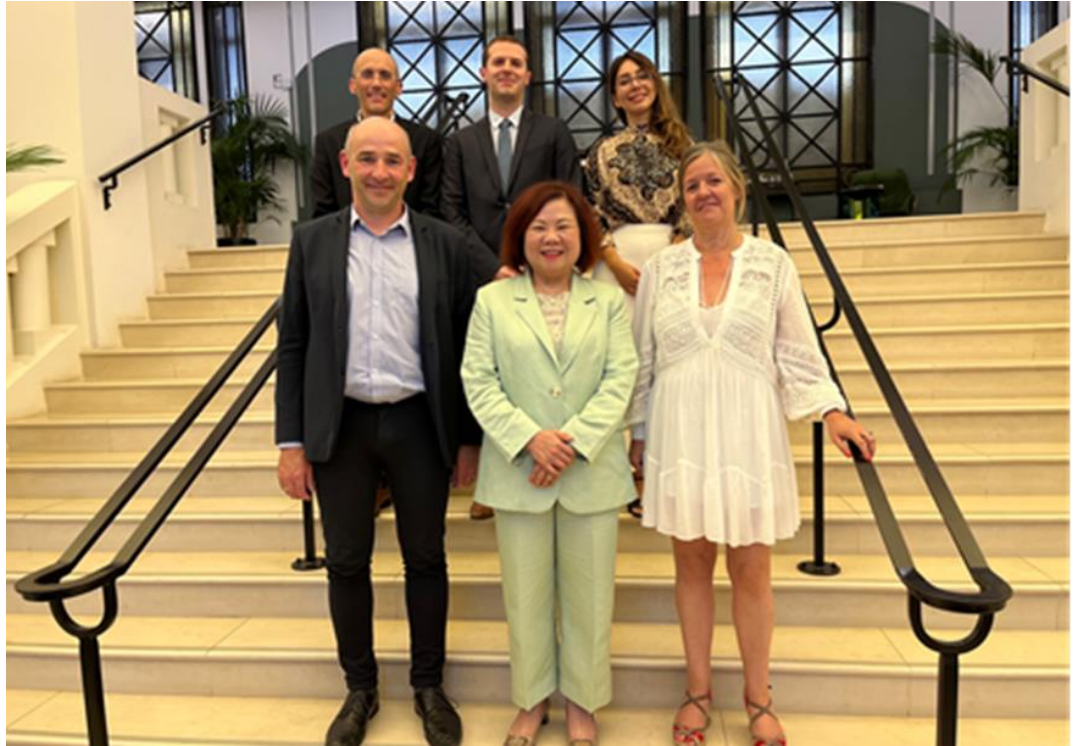
圖16：許銘春部長與法國技能組織正代表（前排左1）等人合影