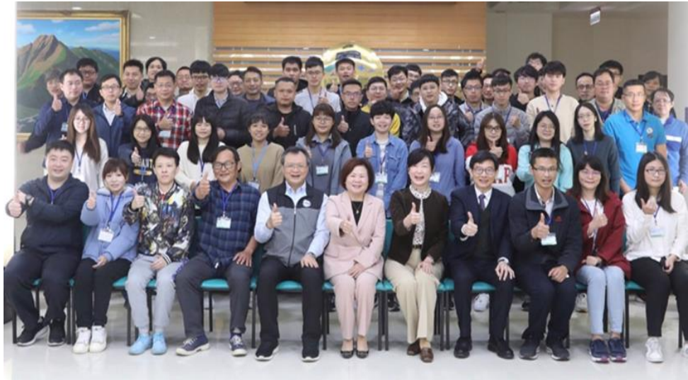
圖1：許銘春部長與保訓會郝培芝主委及學員開訓大合照

112. 03. 13- 針對全國勞動檢查機構新進同仁，辦理「第44期勞動檢查員職前 112. 04. 14 訓練」，為展現捍衛勞動權益的決心，許銘春部長於開訓當日親自前往訓練班勉勵檢查員應勇於任事，並期許檢查同仁能夠持續提升專業知能，廉潔自持，一起為勞工權益打拼。