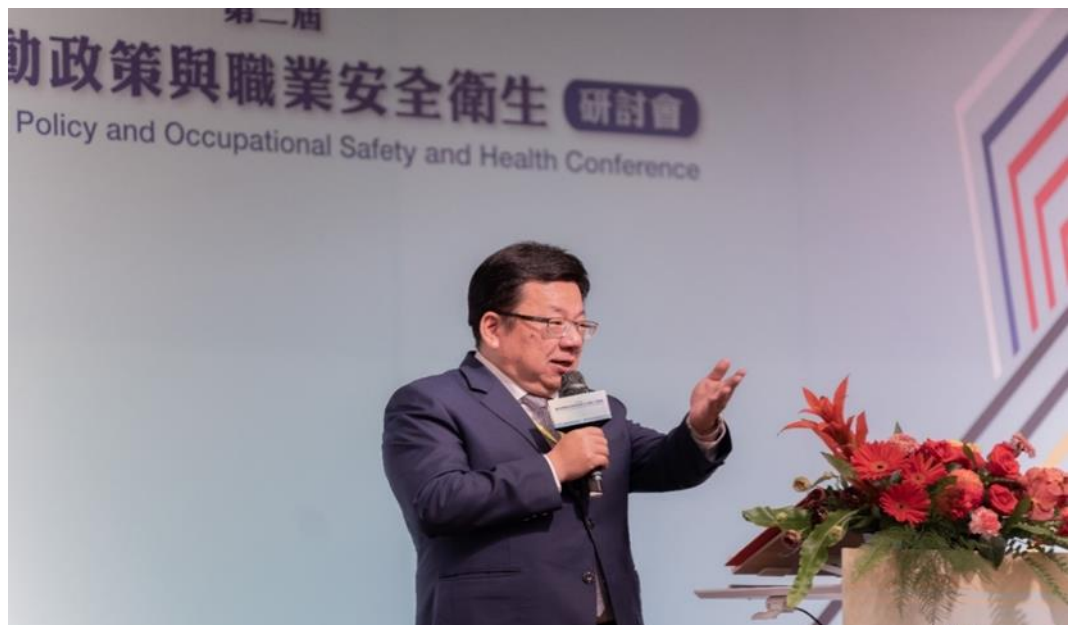
圖8：本部政務次長李俊俛於第2屆臺比勞動政策及職業安全衛生研討會開幕致詞