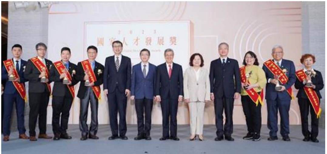
圖14：2023國家人才頒獎典禮合影2