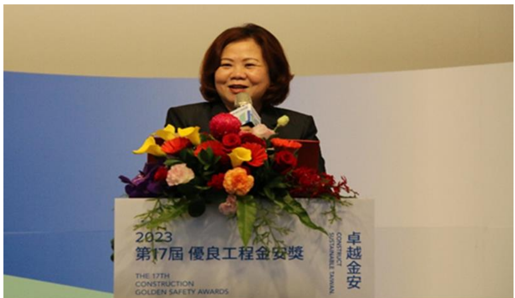
圖7：本部部長許銘春於第17屆優良工程金安獎頒獎典禮致詞