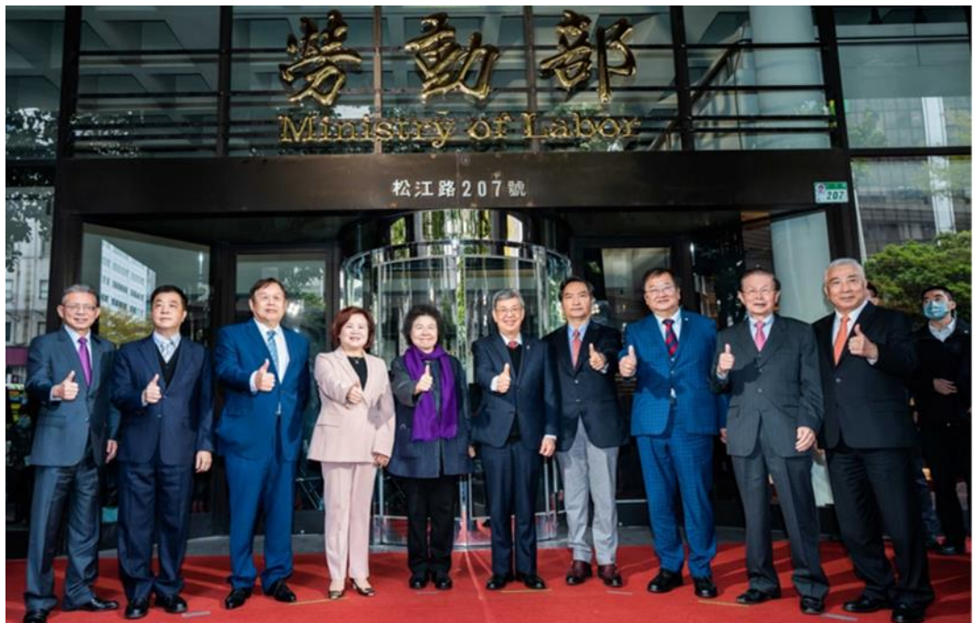
圖5：勞動部進駐松江路志清大樓提供服務。(左起)林三貴前次長、陳雄文前部長、潘世偉前部長、本部部長許銘春、監察院院長陳菊、行政院院長陳建仁、行政院政務委員羅秉成、立法院立法委員邱泰源、趙守博前主委、詹火生前主委