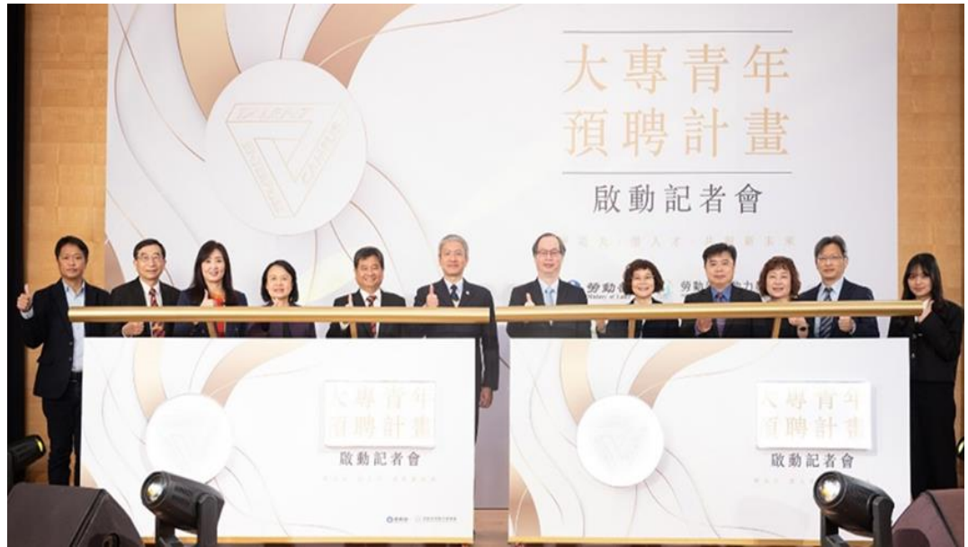
圖1：本部常務次長陳明仁、勞動力發展署署長蔡孟良及重點產業、大專校院青年等各界貴賓代表於記者會上進行啟動儀式

112.01.10 輔導澎湖地區惠民醫院成為離島地區首家職業傷病診治網絡醫院，宣示共同守護離島地區勞工朋友身心健康。