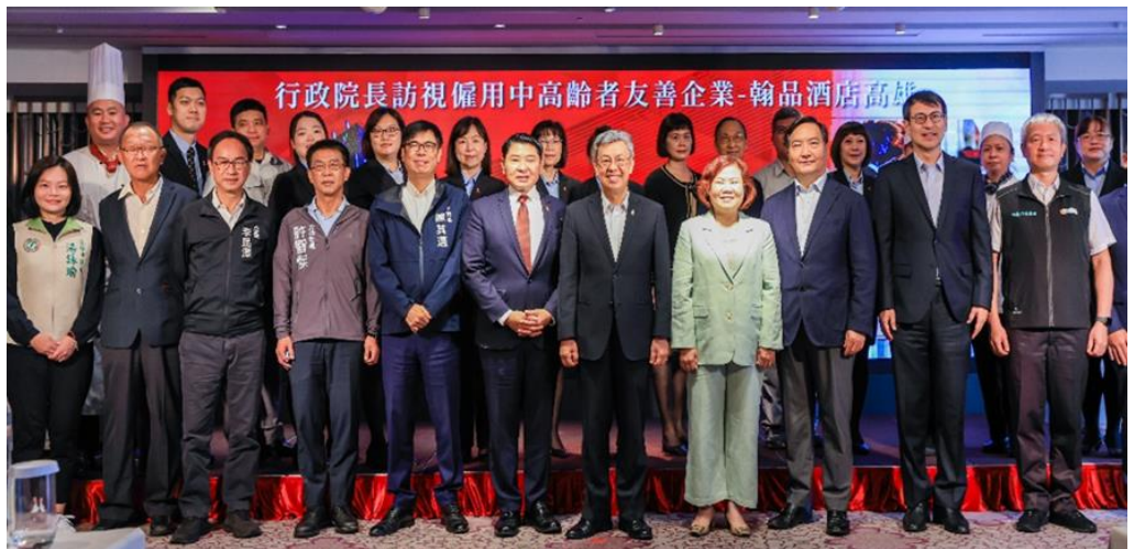
圖7：行政院長陳建仁（前排右4）及勞動部長許銘春（前排右5）蒞臨高雄翰品酒

因應我國人口面臨高齡少子化衝擊，行政院長陳建仁與勞動部部長許銘春視察僱用中高齡友善單位-翰品酒店高雄善用中高齡者及高齡者人力情形，期勉事業單位與政府共同合作營造友善就業環境。