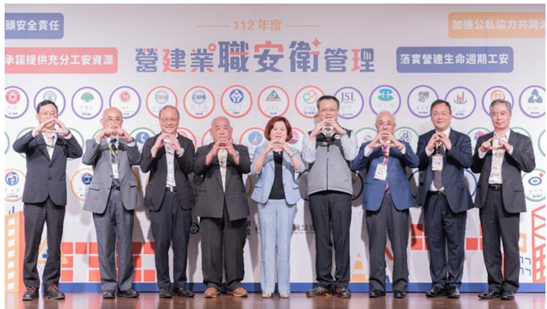
圖6：許銘春部長與營建產業團體代表共同簽署減災宣言、期勉工程零職災