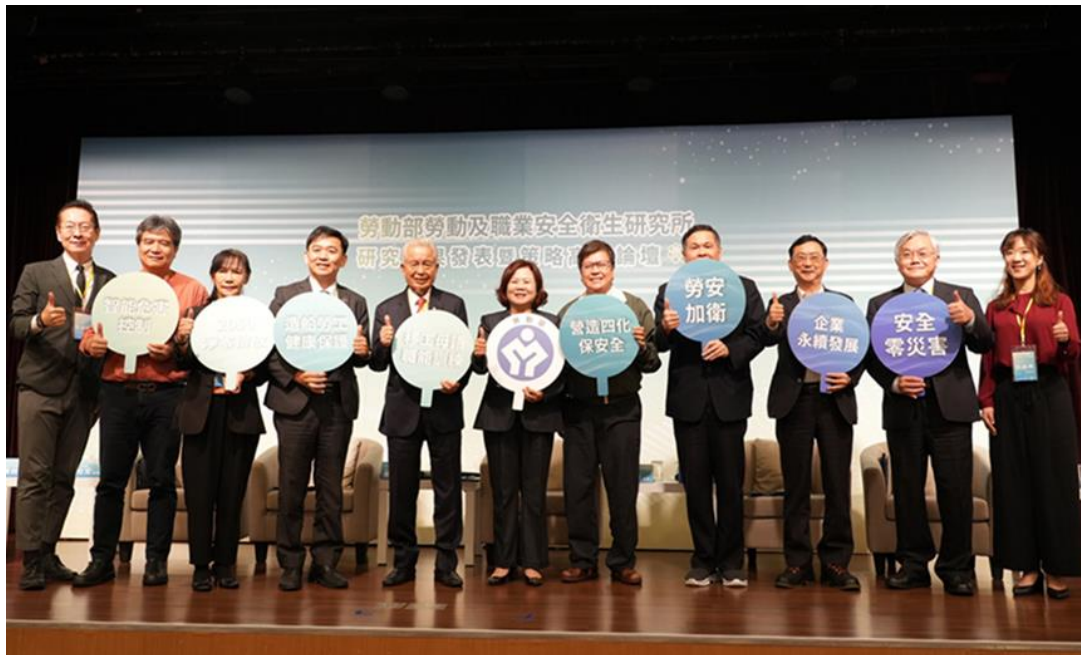
圖2：本部部長許銘春於「研究策略高階論壇」與談貴賓合影留念

本部勞動及職業安全衛生研究所假高雄及台北舉辦「研究成果發表會」，並由許銘春部長主持「研究策略高階論壇」。除提供各界瞭解勞動及職業安全衛生最新研究趨勢，將勞動權益及職業安全衛生概念擴及社會大眾、培養勞工預防職業災害之觀念以降低工作場所職業災害之發生。並透過產官學的交流與對話，推動整合型研究計畫，期能有效解決勞工實務所遭遇的問題，確保勞動權益與職場安全衛生。