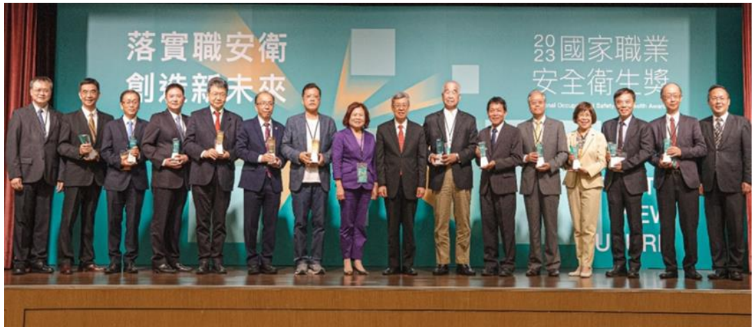
圖3：行政院院長陳建仁、本部部長許銘春與全體得獎企業代表及個人合影。